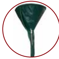
Capa contra pó

Espaço para o botijão de 13 Kg, de gás GLP na sua base.